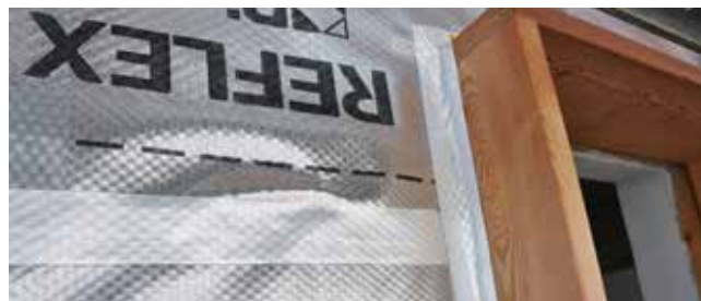
Tesnjenje paroprepustne folije USB Reflex PLUS okrog oken

Nameščanje: poiščemo mesta, ki jih bomo lepili, paziti moramo, da je površina povsem čista (ni prašna, nemastna) in suha, v nasprotnem primeru uporabimo USB Primer, s katerim očistimo podlago. Ko odrežemo željeno dolžino traku, odstranimo zaščitni papir, trak prilepimo in prične močnejše pritiskati na hrbtno stran, najbolje je, če si pomagamo z valjčkom, saj bo tako zagotovljen enakomeren in učinkovit oprijem.